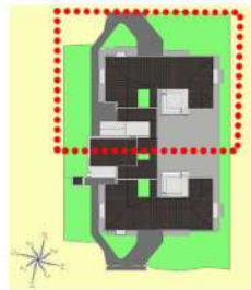
PLANIMETRIE GÉNÉRALE AVEC ZONE DE ÉLARGISSEMENT