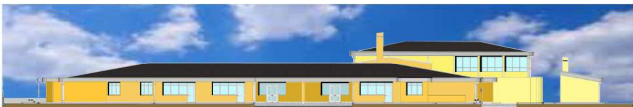
FAÇADE PRINCIPALE (ENTRÉE)