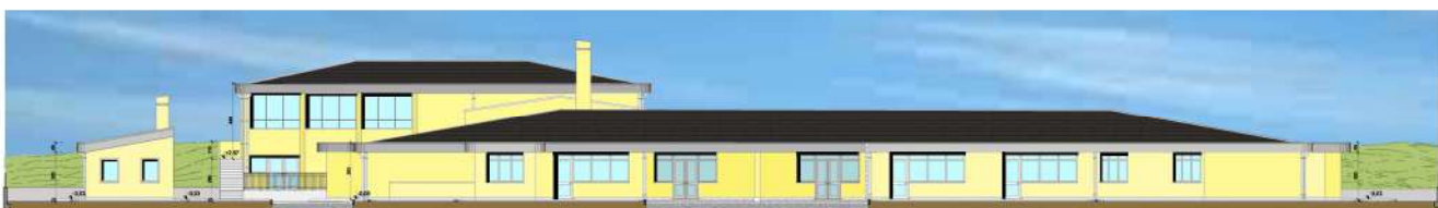
FAÇADE PRINCIPALE (ENTRÉE)