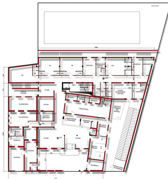
PIANTA PIANO TERRENO