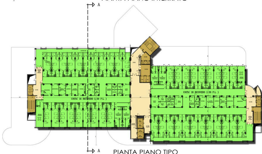
PIANTA PIANO TIPO