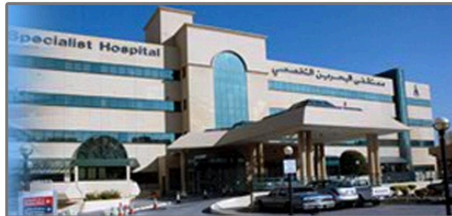
PROSPETTO PRINCIPALE CLINICA