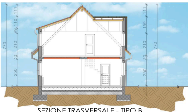
SEZIONE TRASVERSALE - TIPO B