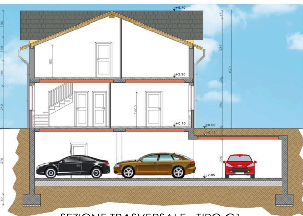
SEZIONE TRASVERSALE - TIPO C1