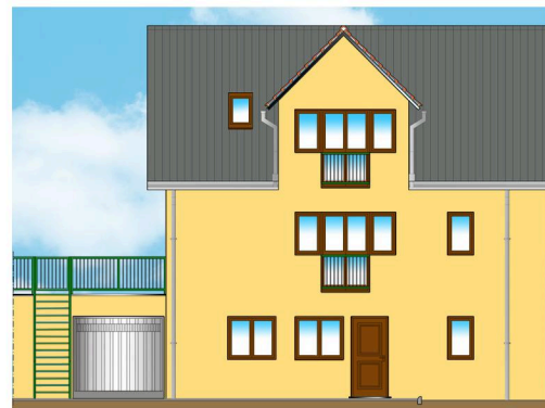
PROSPETTO FRONTALE - TIPO D