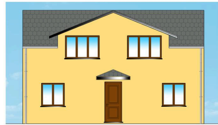
PROSPETTO FRONTALE - TIPO C1