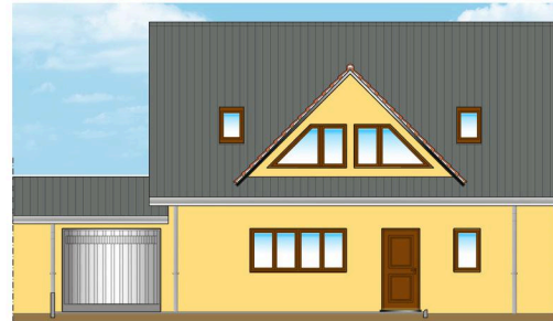
PROSPETTO FRONTALE - TIPO B