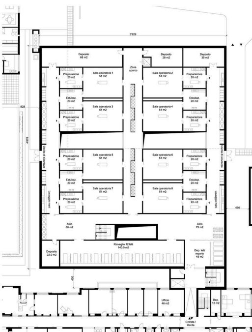
SURGICAL - PROPOSITION DU CLIENT