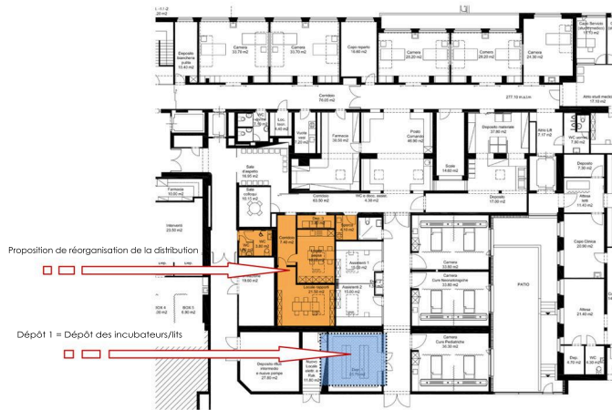
MÉDECINE INTENSIVE - PROPOSITION DE VARIATION