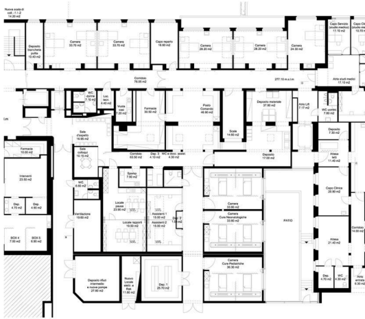
MÉDECINE INTENSIVE - PROPOSITION DU CLIENT

ANALYSE DES SOLUTIONS ARCHITECTURALES IDENTIFIÉES POUR L'EXPANSION DE MÉDECINE INTENSIVE ET DU BLOC OPERATOIRE DANS L'HÔPITAL REGIONAL DE BELLINZONA ET VALLES