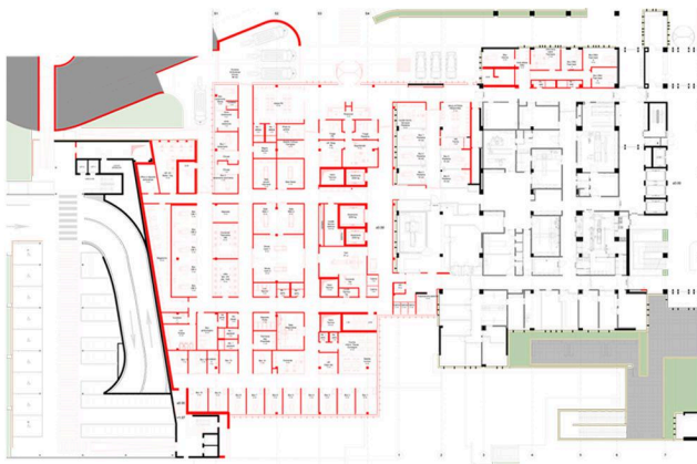
PREMIERS SOINS D'URGENCE - PROPOSITION DU CLIENT