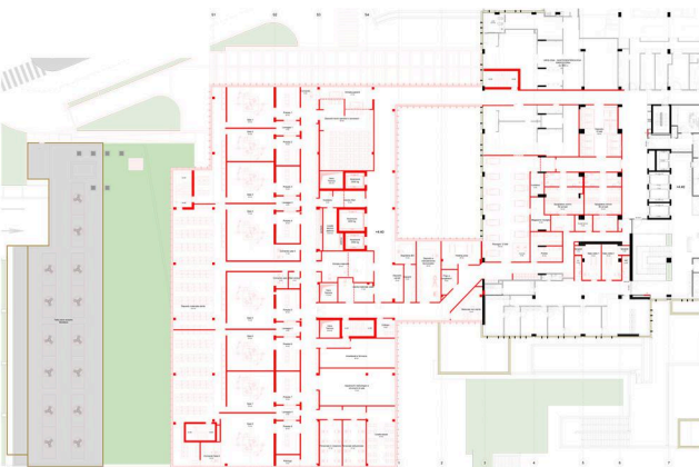
SURGICAL - PROPOSITION DU CLIENT