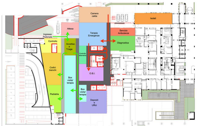
PREMIERS SOINS D'URGENCE - PROPOSITION DE VARIATION