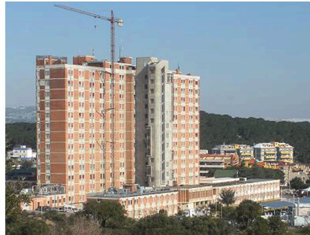
HÔPITAL "SAN FRANCESCO" - NUORO