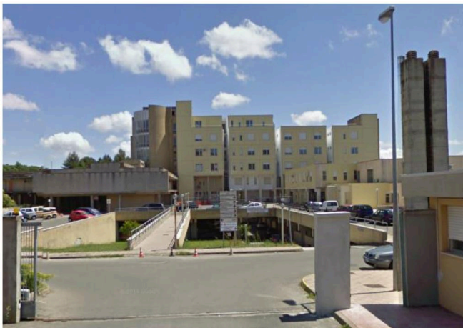
CENTRE DE SANTÉ DE MACOMER