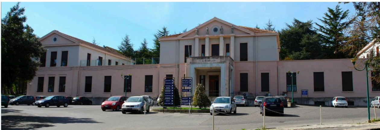
HÔPITAL "CESARE ZONCHELLO" - NUORO