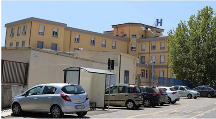
HÔPITAL "SAN CAMILLO" - SORGONO

COMMETTANT: PSSC (POLO SANITARIO SARDEGNA CENTRALE) - NUORO ANNÉE: 2009-2013 FINANÇÉ PAR: BANCA INFRASTRUTTURE INNOVAZIONE E SVILUPPO (MILAN) LIEU: NUORO, SORGONO (NUORO), MACOMER (NUORO), SINISCOLA (NUORO) (ITALIE) DESCRIPTION: 80,675 m 2 MONTANT DES TRAVAUX: € 66,294,818 SERVICES OFFERTS: ÉVALUATION TECHNIQUE