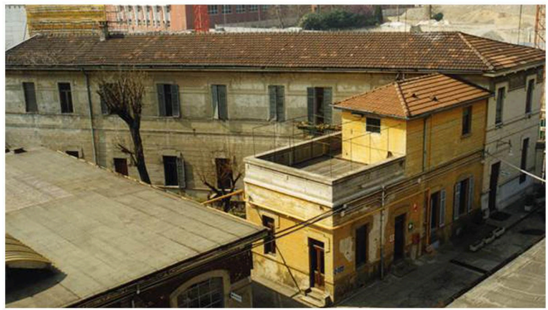
EDIFICIO INTERNO ALLA PROPRIETÀ (MILANO)