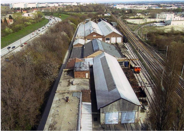
EDIFICI INTERNI ALLA PROPRIETÀ (VIENNA)

SERVIZI PRESTATI: VALUTAZIONE TECNICA, ASSISTENZA PER L'ACQUISTO