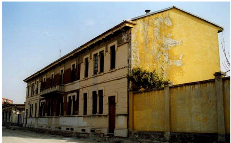
EDIFICI INTERNI ALLA PROPRIETÀ (MILANO)