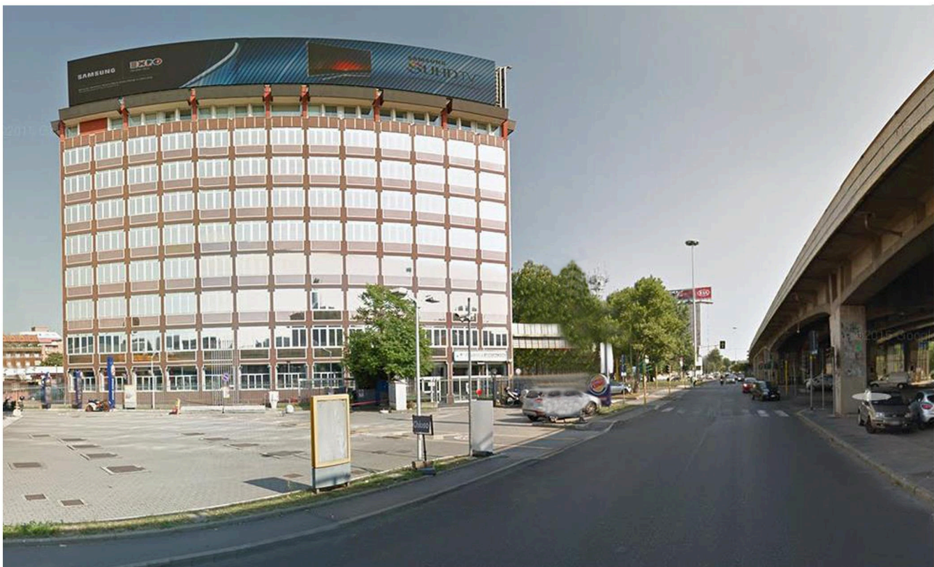
VIEW OF THE REAL ESTATE COMPLEX