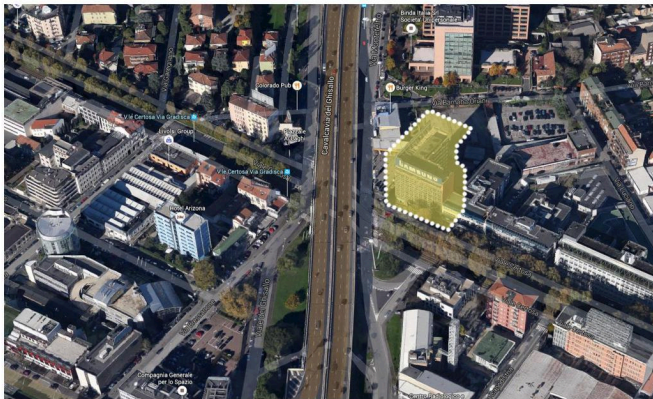
VIEW FROM THE ABOVE WITH INDICATION OF THE BUILDING

CLIENT: INA - ASSITALIA PERIOD: 2000 FUNDED BY: MERRILL LYNCH INTERNATIONAL (LONDON) LOCATION: MILAN (ITALY) DESCRIPTION: 40,200 m 3 SERVICES PROVIDED: TECHNICAL EVALUATION