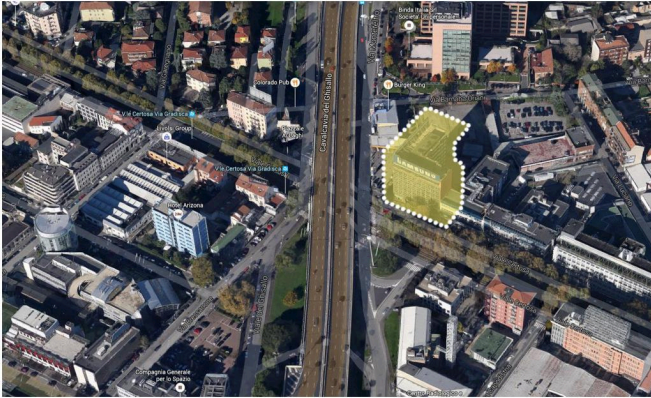
VUE DE DESSUS AVEC L'IDENTIFICATION DU BÂTIMENT

COMMETTANT: INA - ASSITALIA ANNÉE DE RÉALISATION: 2000 FINANCÉ PAR: MERRILL LYNCH INTERNATIONAL (LONDRES) LIEU: MILAN (ITALIE) DESCRIPTION: 40,200 m 3 SERVIZI PRESTATI: PROJECT MANAGER ET CHEF D'ÉQUIPE DU GROUPE DE VALIDATION TECHNIQUE