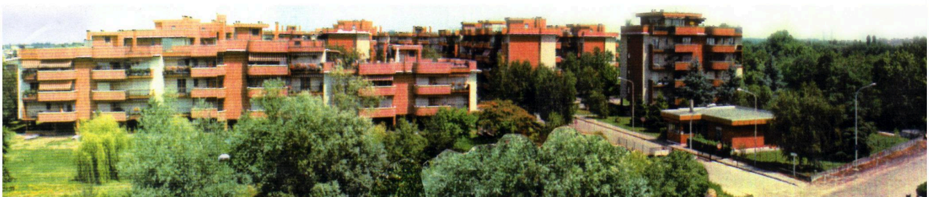
VISTE DEL COMPLESSO IMMOBILIARE