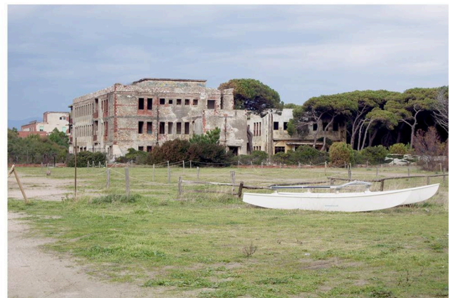
EX-COLONIA SARAGAT A MARINA DI GROSSETO