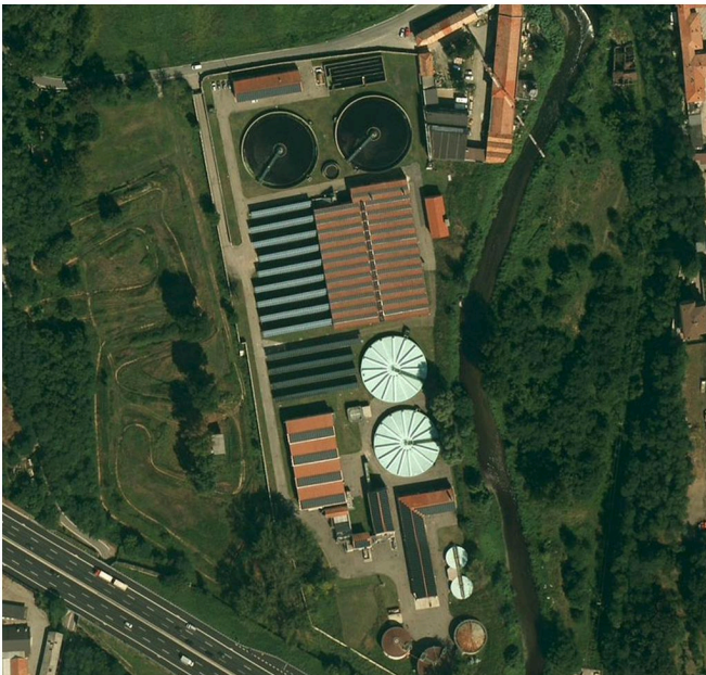
DEPURATORE DI OLGiate OLONA (VA)

Il piano di risanamento del Gruppo Ravazzani prevede una revisione tecnica su tutte le proprietà delle società appartenenti al gruppo, con l'accertamento dello stato tecnico-amministrativo e dello stato di fatto edilizio delle proprietà e delle attività immobiliari del Gruppo. Tra gli edifici vi sono: