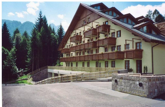
RESIDENZA NEVESOLE A FOLGARIDA (TN)

- il villaggio turistico Riva dei Cavalleggeri a San Vincenzo (30 edifici per circa 430 camere);