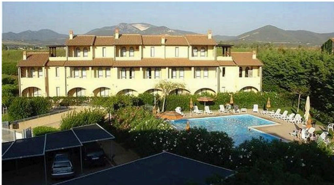
RESIDENZA DEI CAVALLEGGERI A SAN VINCENZO (LI)

SERVIZI PRESTATI: PROJECT MANAGEMENT E TEAM LEADER DEL GRUPPO DI VALIDAZIONE TECNICA