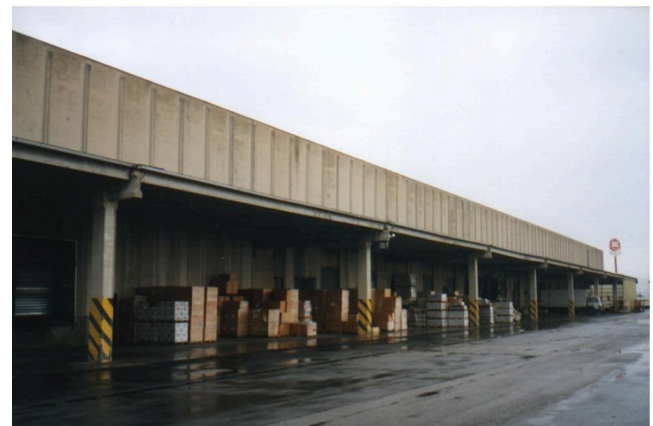
FIANO ROMANO: DÉPÔT