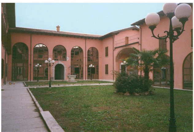
PADENGHE SUL GARDA: BÂTIMENT FINI