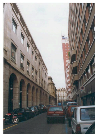
TORINO: BÂTIMENT D'ÊTRE TERMINÉE