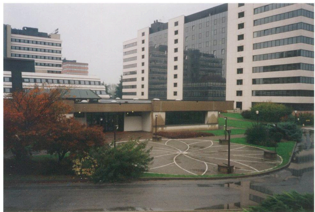
AGRATE BRIANZA: BÂTIMENT FINI