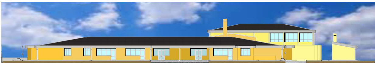
FAÇADE PRINCIPALE (ENTRÉE)