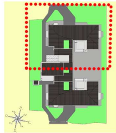
PLANIMETRIE GÉNÉRALE AVEC ZONE DE ÉLARGISSEMENT