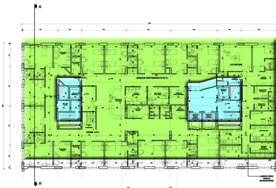
PLAN DU 3 ÈME ÉTAGE