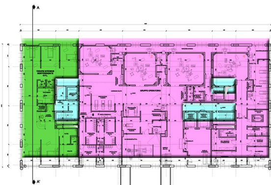
PLAN DU 5 ÈME ÉTAGE